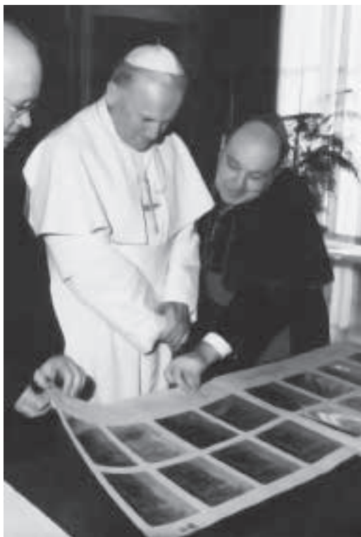
Jan Paweł II 13 IV 1980 r. przybył do Turynu, aby ujrzeć Całun na prywatnym wystawieniu. Razem z kard. A. Ballestrero, arcybiskupem Turynu, przyglądają się opracowaniom twarzy z Całunu.