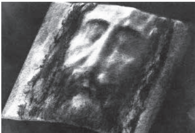
Na podstawie Calunu komputerowo odtworzono obraz twarzy.

i Szymona? A Jego siostry, czy nie mieszkają tutaj wśród nas?”. Jezus do tego stopnia jest uważany za dzielącego sytuację swojego narodu, że nie ma żadnego prawa, by pretendować do zbyt wielkiego podziwu: „I powątpiewali w Niego” (tamże). Z drugiej strony jest oczywiste, że osiągnął On dojrzałość w taki sam sposób, jak Jego rówieśnicy, poprzez wychowanie, które otrzymał, i pracę, jaką wykonywał w domu rodzinnym. Jego ręce umęczone przebitymi gwoździemi posługiwały się narzędziami pracy, które wymagały siły i precyzji. Jego ramiona, które niosły patibulum crucis 3 , przez wszystkie lata ukrytego życia, gdy przygotowywał się do aktywnego przepowiadania, nosiły inne belki, deski i przyrządy.