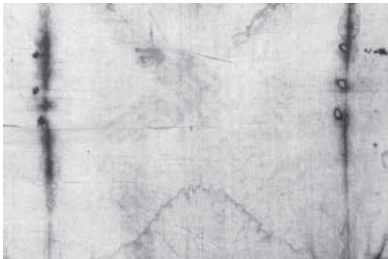
Ślady wskazują, że ręce były przybite do krzyża w nadgarstkach, a nie dłoniach.

Mimo to relacja między Całunem a Eucharystią nie jest bardzo odległa. W obu przypadkach do rzeczywistości dochodzi się poprzez znak, który zawsze ma prosty charakter: nie ma nic bardziej nieznaczącego jak hostia, na której dopiero spocznie wszechmocne i przemieniające słowo Jezusa powtarzane w Kościele przez kapłanów, i nic bardziej ulotnego i uboższego, jak wizerunek, który nieśmiało ukazuje się z płótna Całunu. W obu przypadkach rzeczywistość, do której odsyła znak, jest o wiele większa i bardziej niewyraźna niż sam znak, oczywiście z olbrzymimi różnicami, które przebiegają między realną obecnością człowieczeństwa i boskości Jezusa w Eucharystii a wymownym i bolesnym nawiązaniem do cierpień widocznych na świętym Całunie. Jednak w obydwu przypadkach kontrast między prostotą znaku a niewysłowionym bogactwem rzeczywistości, do której on odsyła, jest odwołaniem do obecności Bożej mocy, większej niż wszelkie ludzkie rozumowanie.